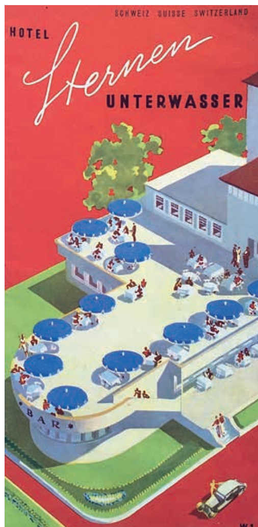
Hotel Sternen Unterwasser, Bar, Anbau West, 1935. Postkarte

Auf der Westseite des Stammhauses wurde der glatt verputzte Unterhaltungstrakt von Architekt Heinrich Giezendanner angedockt. Erstmals konnte er sich, weg vom Heimatstil, einer modernen Ausdrucksweise bedienen. Vom Dorfkern her gesehen, wirkte der runde Abschluss wie ein Schiffsbug. Dahinter war die Bar eingebaut, die städtische Art-déco-Mondänität ausströmte. An den Wänden waren hochformatige Bilder von einem nicht mehr bekannten Maler mit Wintersportszenen eingelassen. Eines zeigte eine Dame von Welt im schneeweissen Pelz. Und im Dancing wurde mit Livemusik unterhalten. Für den Terrassenbetrieb wurde ein Treppenaufgang entlang der Rundung geführt, bedient hingegen wurde über das Café im Stammhaus. Der Sternen war nach der Fertigstellung anscheinend über die Grenzen bekannt und konnte für zwei Winter den