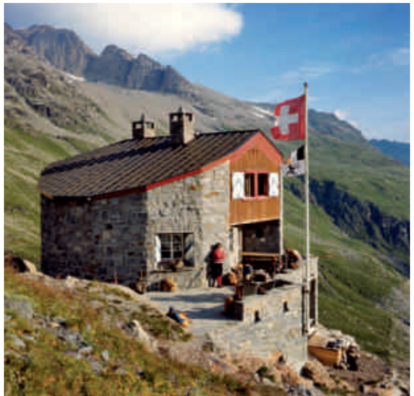
Abb.9 Bordierhütte im Mattertal VS, 1927 in traditioneller Steinbauweise des 20. Jahrhunderts erbaut. Aufnahme um 1960