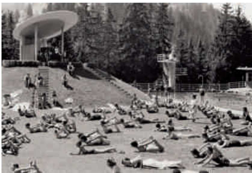
Abb. 12 Adelboden BE. Das 1931 eröffnete Freibad Gruebi war ein Entwurf des Freiburger

nen der Natur und der Witterung. Die bauliche Analogie dieser Archetypen zu den frühen Unterkünften alpiner Hirten ist auch hier auffallend. Die einfachen Steinbauten, erstellt mit Baumaterialien aus der näheren Umgebung, hatten meist nur eine kurze Lebensdauer, bis zur Jahrhundertwende wurden sie mehrheitlich durch grössere und komfortablere Neubauten ersetzt.