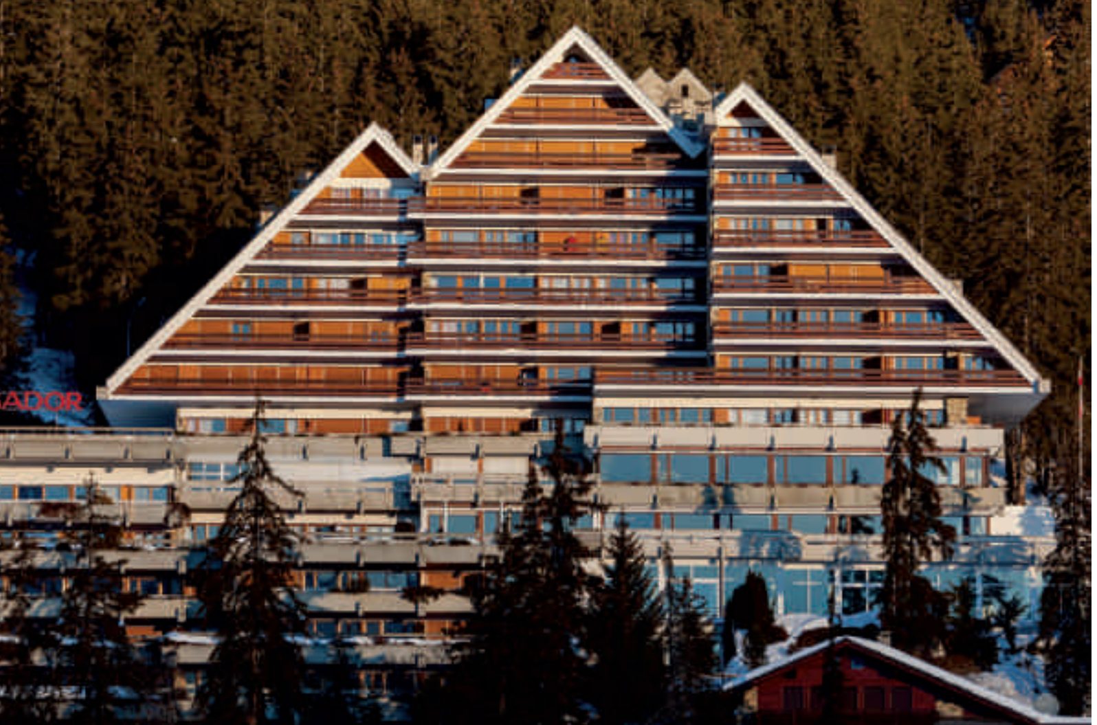
Abb. 16 Crans VS. Die eigenwillige Architektur des 1972 eröffneten Hotels Ambassador in Crans fand kaum Nachfolger in den Schweizer Alpen

In der Schweiz fand die neue Bauweise neben zahlreichen Wohngebäuden vor allem in den damaligen Lungenkurorten grosse Verbreitung: Davos und Arosa in Graubünden sowie Montana und Leysin in der Westschweiz gehörten zu den Zentren dieser Entwicklung. Dazu kamen einige Fremdenverkehrsorte, bei denen die Bettenkapazität Nachholbedarf aufwies und die deshalb, trotz Hotelbauverbot, zu neuen Hotelbauten kamen, wie beispielsweise Villars und Crans in der Westschweiz oder Lenzerheide und Unterwasser in der Deutschschweiz. 15 Zu den bekanntesten, immer wieder erwähnten Bauten dieser Epoche gehören im schweizerischen Alpenraum das 1930 in Crans-Montana als Sanatorium eröffnete «Bella Lui», ein Gemeinschaftswerk der Architekten Rudolf und Flora Steiger-Crawford (1900–1982; 1899–1991) mit Arnold Itten (1900–1953), oder das Sanatorium Clavadel bei Davos nach Plänen des einheimischen Architekten Rudolf Gaberel (1882–1963). Zu den wenigen reinen Hotelbauten aus dieser Zeit gehört das Doppelhotel Alpina-Edelweiss in Mürren des Thuner Architekten Arnold Itten, bei dem kurz zuvor der später berühmte niederländische Architekt Mart Stam (1899–1986) gearbeitet hatte (Abb. 11). 16