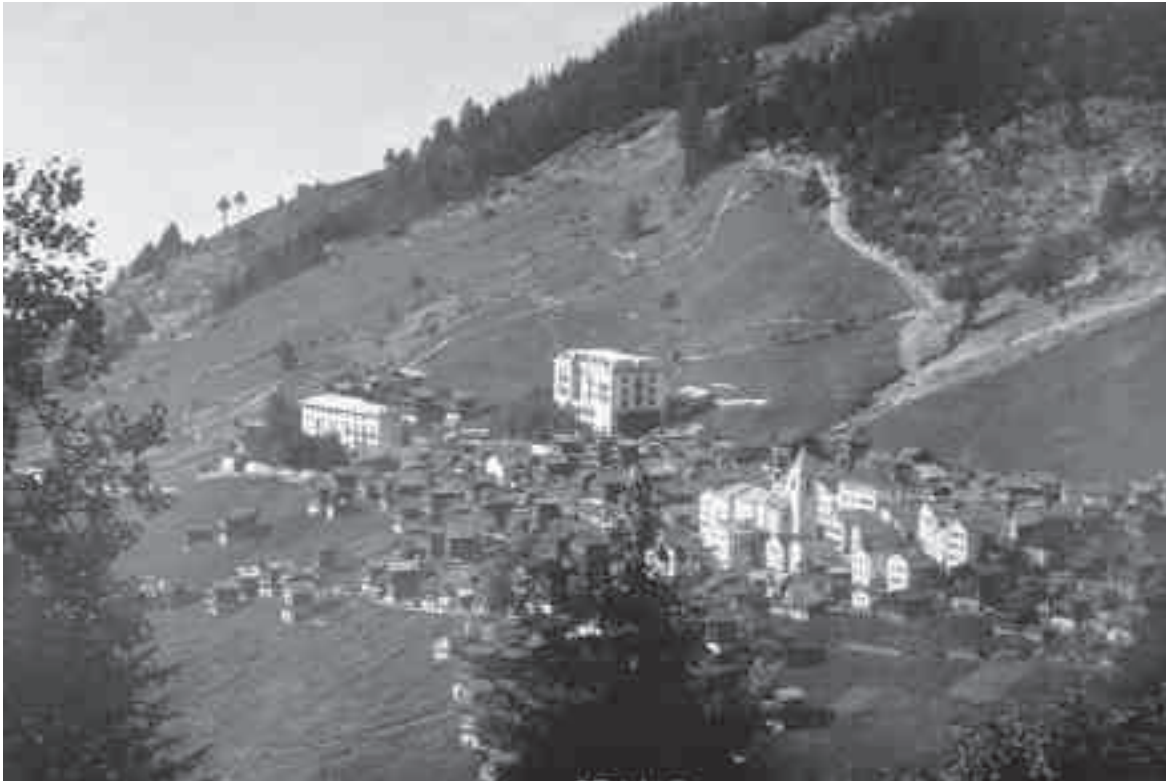
Abb.5 St-Luc VS. Ansicht des Dorfes St-Luc um 1900 mit dem nach dem Brand von 1858 in Steinbauweise wieder aufgebauten Dorfkern, dem Hotel Bella Tola (links, 1882/83 erbaut, 1889 erweitert) und dem Grand Hôtel du Cervin (1893 eröffnet)