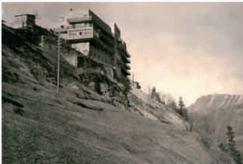
Abb. 11 Mürren BE, Hotels Alpina und Edelweiss. Die beiden zusammengebauten Hotels entstanden nach einem Brand der Vorgängerbauten in einer kompromisslosen Moderne nach Plänen des Thuner Architekten Arnold Itten

Ingenieurs Beda Hefti. Foto um 1950