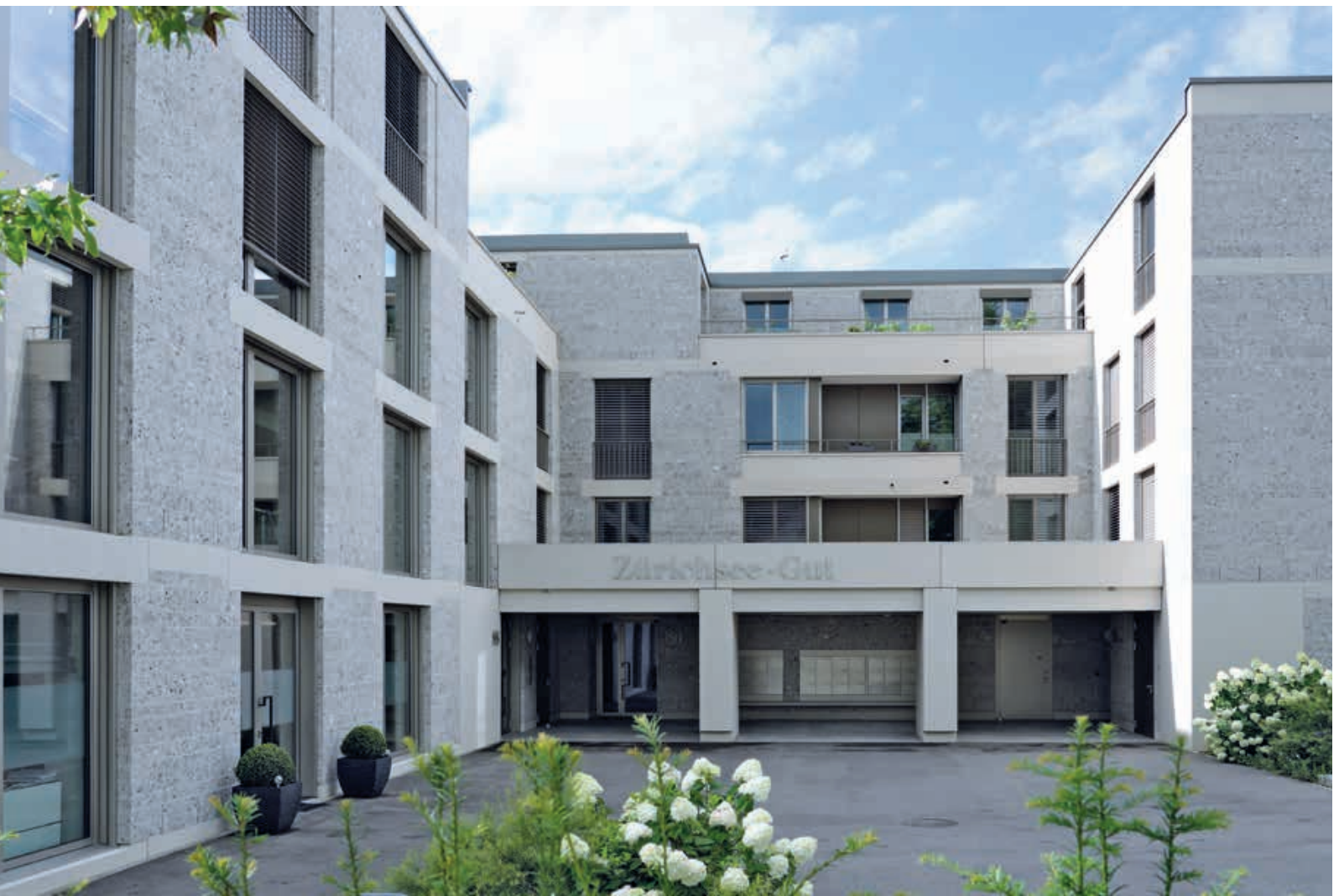
Abb.8 Zürichsee-Gut, Stäfa, Meier Hug Architekten, 2014–2017.

stein in Terrazzooptik. Die dunklen Bodenplatten im Treppenhaus indes, die eigens aus regionalen Konglomeratfindlingen gesägt wurden, sind von Kunststein nicht zu unterscheiden.