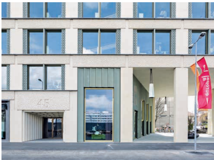
Abb.7 Wohn- und Geschäftshaus Europaallee, Zürich, Caruso St John Architects, 2007–2013.

künstlichen Anmutung dieses natürlichen Materials und setzen sowohl im Aussen- wie auch im Innenraum Konglomeratgesteine ein (Abb. 8). Die durch Kunststeinbänder gegliederte Aussenfassade ist mit Platten aus Brannenburger Nagelfluh verkleidet, einer Natursteinart aus der Region südlich von Rosenheim, die optisch wie geschliffener Waschbeton erscheint. 9 Die Küchenarbeitsplatten in den Wohnungen wurden aus poliertem Marinace Verde, einem brasilianischen Naturstein, gefertigt und wirken wie ein hochwertiger Kunst-