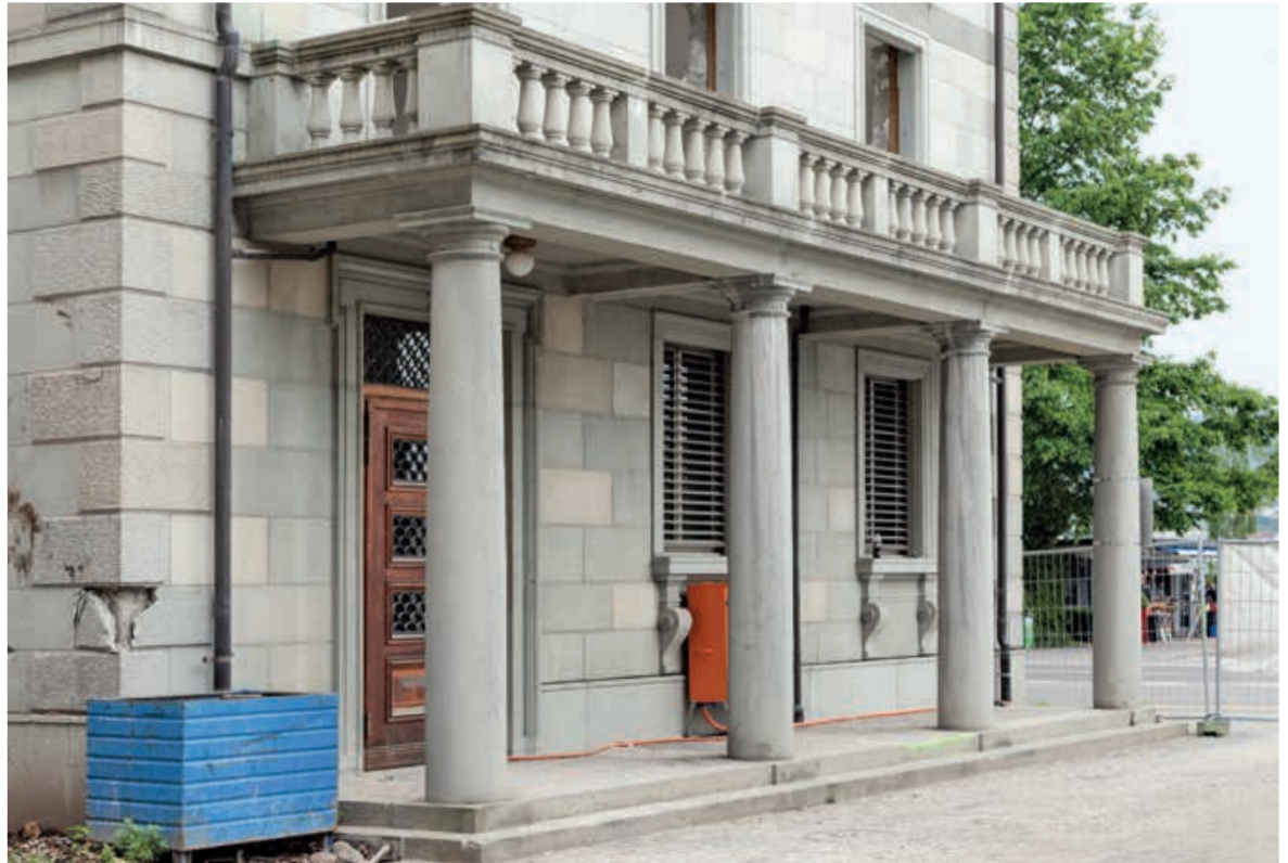
Abb.5 Kunststeinkonsole des Mythenschlosses.