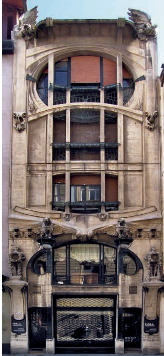
Abb. 2 Ersatz der zurückgearbeiteten Sandsteinquader durch Kunststein an der Südfassade des ETH-Hauptgebäudes, um 1921–1924.

Sandstein ist sicher der am häufigsten imitierte Naturstein, allerdings finden sich in jener Zeit auch Beispiele für andere Natursteinnachahmungen, so zum Beispiel das Wohn- und Geschäftshaus des Architekten Giovanni Michelazzi im Borgo Ognissanti in Florenz von 1911, dessen Fassade aus künstlichem Travertin besteht (Abb. 3). Der zementgebundene Kunststein eignete sich hervorragend für die filigranen Fassadenornamente der im Art-nouveau-Stil gestalteten Casa Vichi und wäre alleine schon aufgrund seiner leichteren Formbarkeit dem Naturstein vorzuziehen gewesen. Allerdings setzte gerade die Imitation des von Natur aus porösen Travertins ein grosses technisches Können voraus, und so spielte bei der