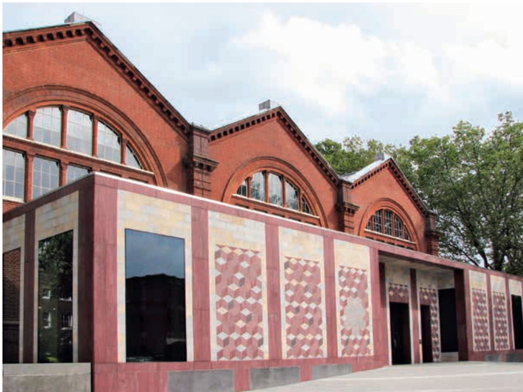
Abb.6 Museum of Childhood, London, Caruso St John Architects, 2002– 2007.

Grossbritanniens verweisen und aus ehemaligen Kolonien stammen (Abb. 6). Allerdings liessen sie die Steine in sehr dünne Platten schneiden und wie Fassadenfliesen verbauen, ein optischer Bruch, der die dem Stein eigene Massivität negiert und auf die veränderten politischen und ökonomischen Verhältnisse verweist.