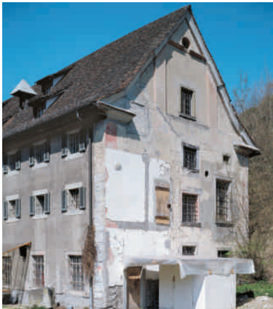
Ostfassade des Zuchthauses , mit Spuren der Farbigkeit des Barockbaus von 1745 und des 1979 abgebrochenen Zellentraktes. Konrad Keller, 2004. © ADPTG

«In einem Land, wo keine dergleichen Anstalten vorhanden sind, kann die Criminalpolizei nur unzweckmässig ausgeübt werden und da die Armut ein nicht zu verhinderndes und hauptsächlich in Krankheit drückendes Übel ist,