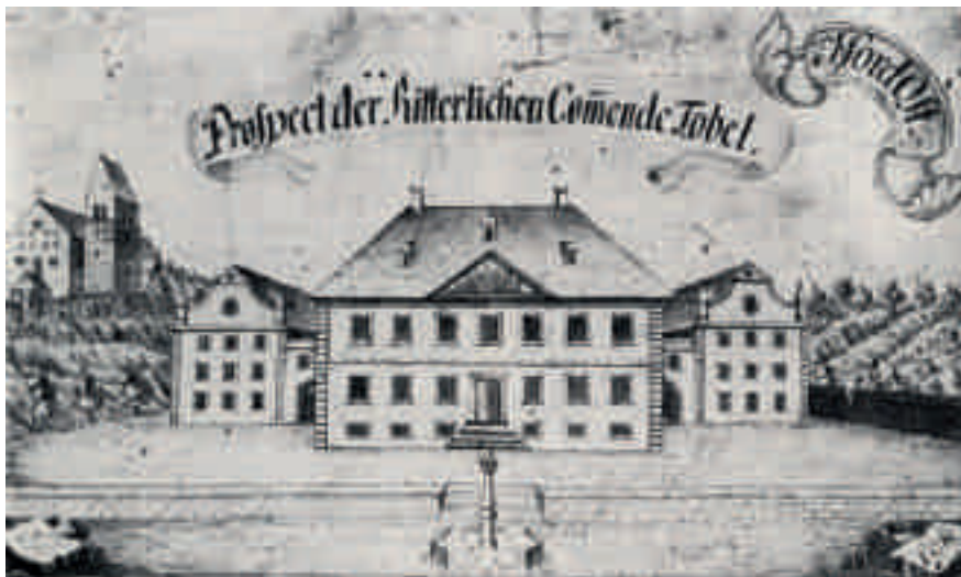
Tobel , wahrscheinliches Projekt von Johann Caspar Bagnato für die Johanniterkommende. Ausschnitt aus einer Karte der Herrschaft, 1745.