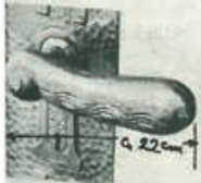
die überlebensgrosse monumentale pest-prachts-ürdlinke