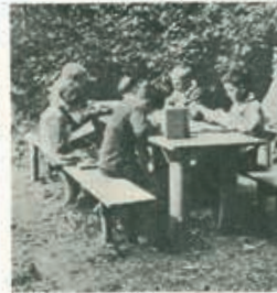
Holzbänke sind billiger, gesünder und bequemer.

Die Forderung, den kindlichen Maßstab zu wahren, soll nicht heißen alles in Miniaturgröße auszuführen, als vielmehr die natürlichen Ansprüche des heranwachsenden Menschen zu erkennen und seine Umgebung darnach zu bilden.