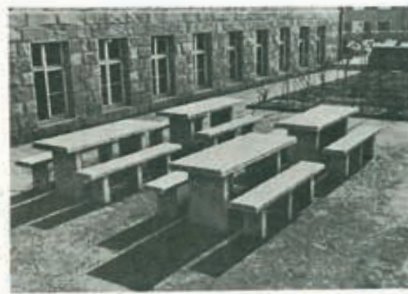
Kalte, harte, monumentale Bänke aus Granitplatten!

Die Forderung, den kindlichen Maßstab zu wahren, soll nicht heißen alles in Miniaturgröße auszuführen, als vielmehr die natürlichen Ansprüche des heranwachsenden Menschen zu erkennen und seine Umgebung darnach zu bilden.