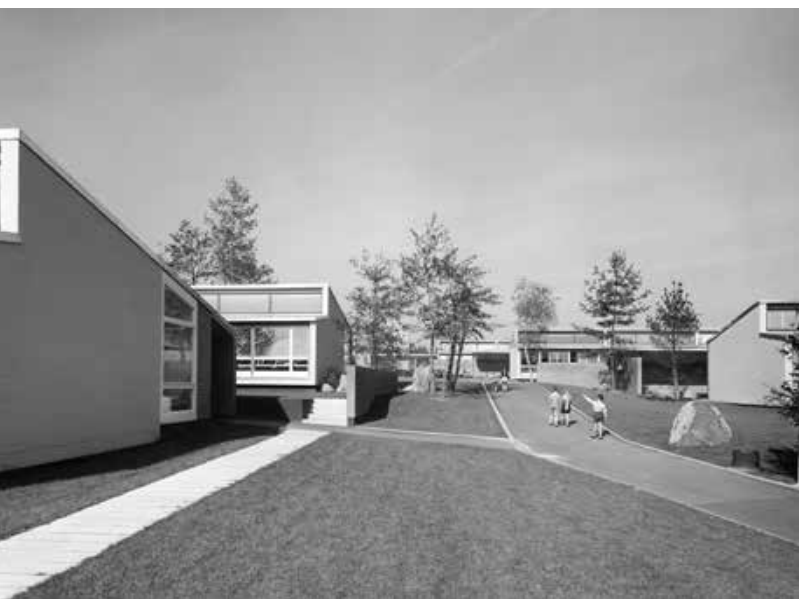
Werner Jaray, Fred Cramer und Claude Paillard, Pavillonschulhaus Chriesiweg, Zürich-Altstetten, erbaut 1956/57, Zugang zur Schulanlage von Südosten mit Kindergarten (links) und Primarschule (rechts). Bild rechte Seite: Klassenzimmer mit Vorraum. Fotos Peter Grünert, um 1957. © Bau-geschichtliches Archiv der Stadt Zürich