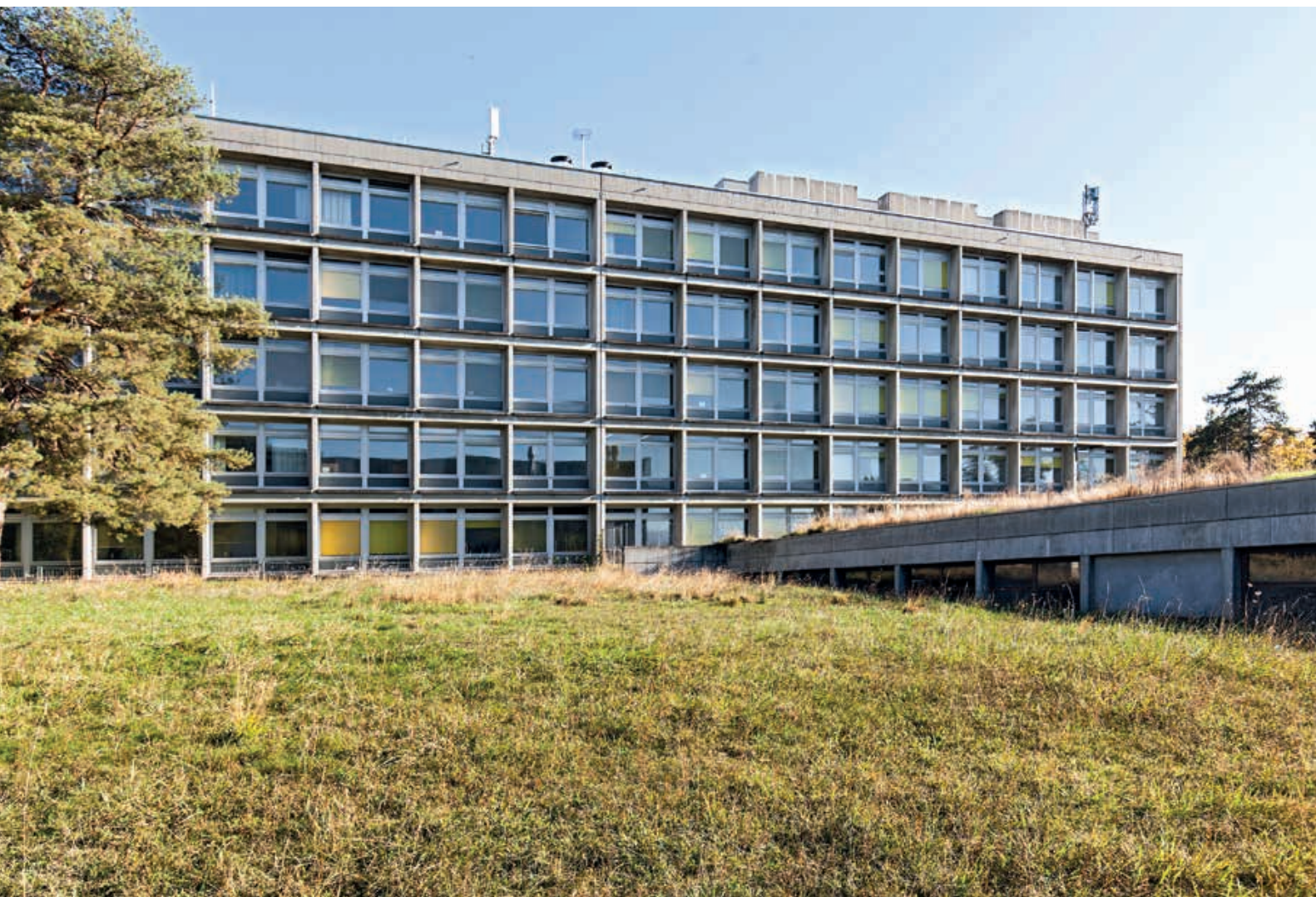
Le bâtiment F et sa structure alvéolaire en béton armé.

l'ensemble une légèreté et une dynamique particulièrement efficaces.