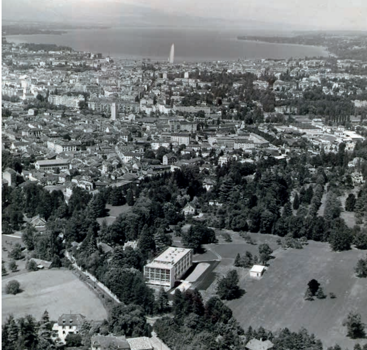
Vue aérienne du site de Battelle avec le premier bâtiment construit (B) en 1954 et l'agglomération genevoise en arrière-plan.