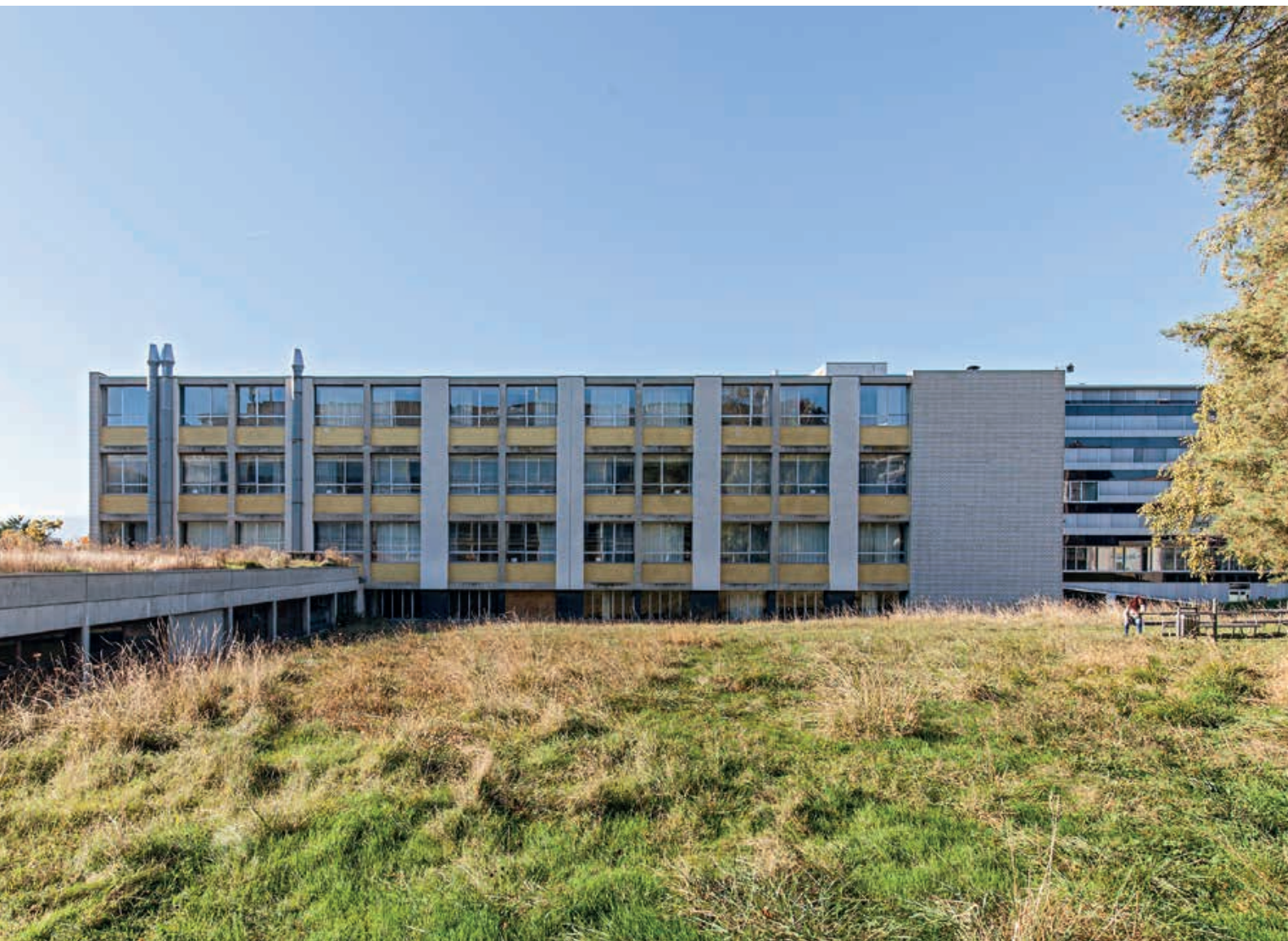
Le bâtiment C et sa façade maçonnée polychrome.

de développement du site. L'architecte commence par superposer au terrain une trame orthogonale uniforme. Tournée à 45 degrés par rapport aux points cardinaux, c'est elle qui définit la position et l'orientation exactes des bâtiments projetés sur le pourtour de la parcelle, délimitant un vaste espace central occupé en partie par un bâtiment bas et allongé. Si cette manière de disposer librement des bâtiments au milieu d'un espace de verdure est conforme aux préceptes de l'urbanisme moderne, ce premier plan d'ensemble n'est pas sans évoquer les campus américains 3 . Trois ans plus tard, un second plan d'ensemble est dessiné par le bureau. S'il conserve dans ses grandes lignes l'esprit du plan précédent, il oriente de manière décisive l'extension future de l'Institut. Ce plan ne s'organise plus autour d'un espace central, mais crée, à partir du bâtiment B existant, une galerie couverte orientée selon un axe nord-est/sud-ouest, le long de laquelle cinq bâtiments de laboratoires viennent