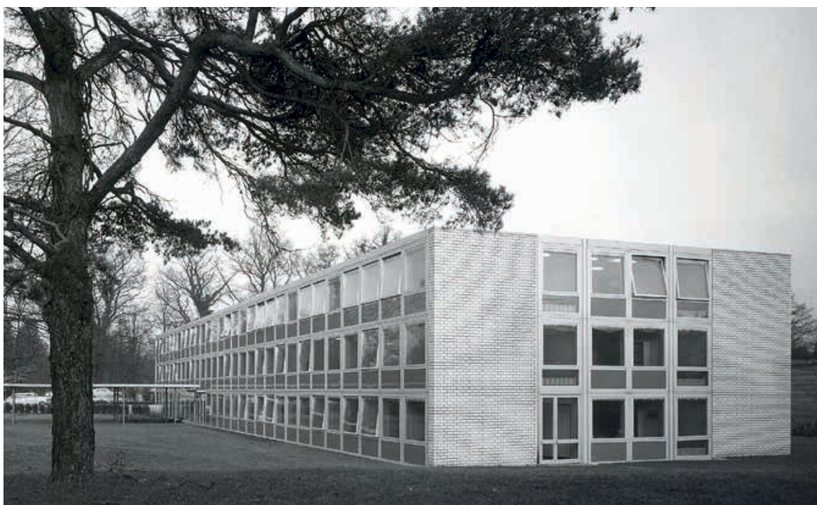
Le bâtiment B à son achèvement en 1954 (en haut). Le bureau de la direction installé dans le bâtiment B : les grandes fenêtres ouvrent sur le paysage environnant (milieu à gauche).