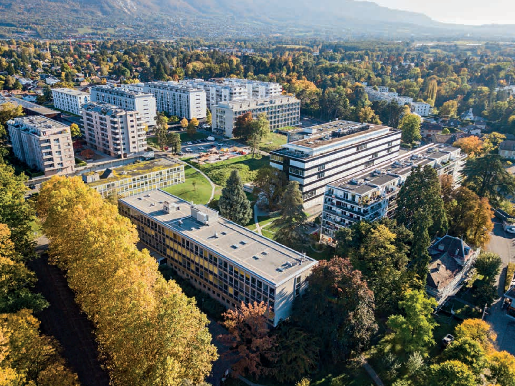
Vue aérienne du site de Battelle aujourd'hui.

garantir la plus grande flexibilité due à la diversité et à l'évolution constante de la recherche. C'est là un aspect essentiel du programme pour lequel Addor répond en proposant une architecture simple, solide, économique et adaptable aux différents besoins. Une ossature constituée de poteaux en béton armé apparent et disposée selon une trame de 4 mètres supporte des dalles à nervures dimensionnées pour recevoir des appareils lourds. Au sein de cette ossature prennent place les cloisons des laboratoires en plots pleins de ciment, pouvant être facilement démolies et reconstruites ailleurs en fonction des nécessités. Quant au langage architectural, il exprime clairement la structure de l'édifice. Les façades longitudinales sont ainsi composées d'un ordre primaire constitué de puissants pilastres enduits (blanc) qui alternent avec un ordre secondaire constitué de poteaux plus fins laissés bruts. Entre ces poteaux, prennent place des contrecœurs en