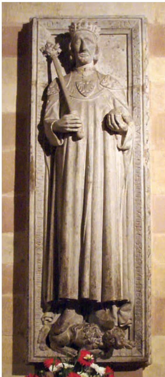
Abb. 7 Rudolf von Habsburg (†1291), Grabplatte von 1285/91 in der Krypta des Speyrer Doms. Die Grabplatte ist aufgrund formaler und stilistischer Übereinstimmungen denselben Bildhauern wie jenen des Hauptportals des Basler Münsters zuzuschreiben.

Ein weiterer Aspekt könnte die These, im ersten Habsburger Königspaar mögliche Auftraggeber des Hauptportals und die Beförderer des Kaiserpaarkultes im Basel des 13. Jahrhunderts zu sehen, bekräftigen: Rudolf von Habsburg berief sich nämlich zur Legitimierung seines Königtums auf seine Vorfahrin Kaiserin Kunigunde von Luxemburg, mit der er mütterlicherseits verwandt war und durch die er auch an die karolingische Dynastie anschloss. 14 Dass er auf ein heiliggesprochenes Kaiserpaar rekurrierte und mit dessen Standfiguren letztlich auch seine Herrschaftseignung kundtun wollte, erscheint plausibel. Beachtenswert ist auch, dass Kaiser Heinrich am Hauptportal mit Kirchenmodell dargestellt ist, dass er also um 1280 eindeutig als Förderer des Münsters bzw. der Kirche gesehen wurde. Falls nun Rudolf von Habsburg Initiator des Portalbaus