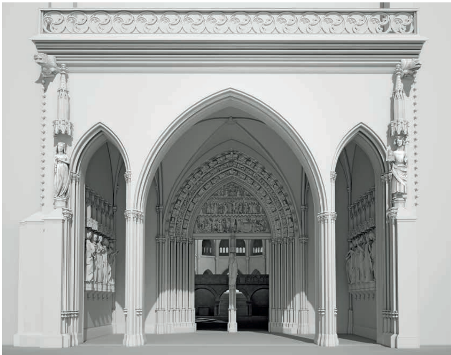
Abb. 2 Das gotische Hauptportal des Basler Münsters, um 1270/85, in einer Rekonstruktion von Marco Bernasconi und Serafin Pazdera, 2011.

1347 in Basel ein. So wurde erstmals im Münster wieder eine Weihnachtsmesse gefeiert, in Anwesenheit des Herrschers und des eben erhaltenen Heiltums. Ein weiterer Grund Bischof Senns für die Reliquienaneignung könnte die Absicht gewesen sein, sich als Wiederhersteller des Bistums Basel, als «Restaurator» vieler Klöster 5 in die Nachfolge des ottonischen Kaiserpaars zu stellen. Dass Kaiser Karl IV. (1316–1378), Urenkel Rudolfs von Habsburg und aus dem Hause Luxemburg wie die Kaiserin Kunigunde, die Kaiserpaarverehrung förderte, kann bisher nicht belegt werden. Nach dem Basler Erdbeben von 1356 kam er aber erneut nach Basel und dürfte den wiederaufgebauten Münsterchor sowie das wiederhergestellte Grabmal der Habsburger Stammutter besucht haben. 6