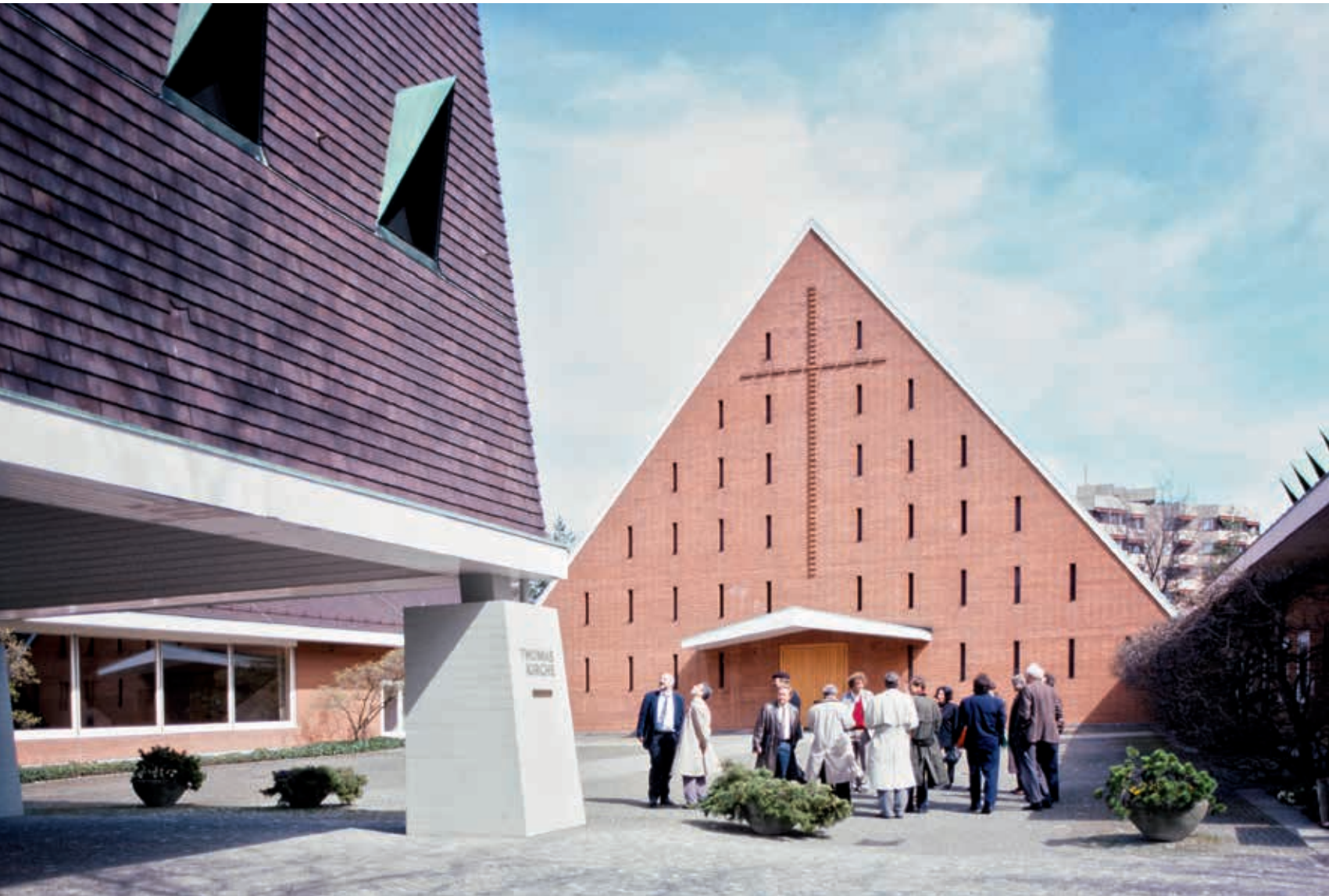
Zurückhaltend gestaltetes Gemeindezentrum: Zürich, Thomas Im Gut, Hans Hofmann 1959–1961.