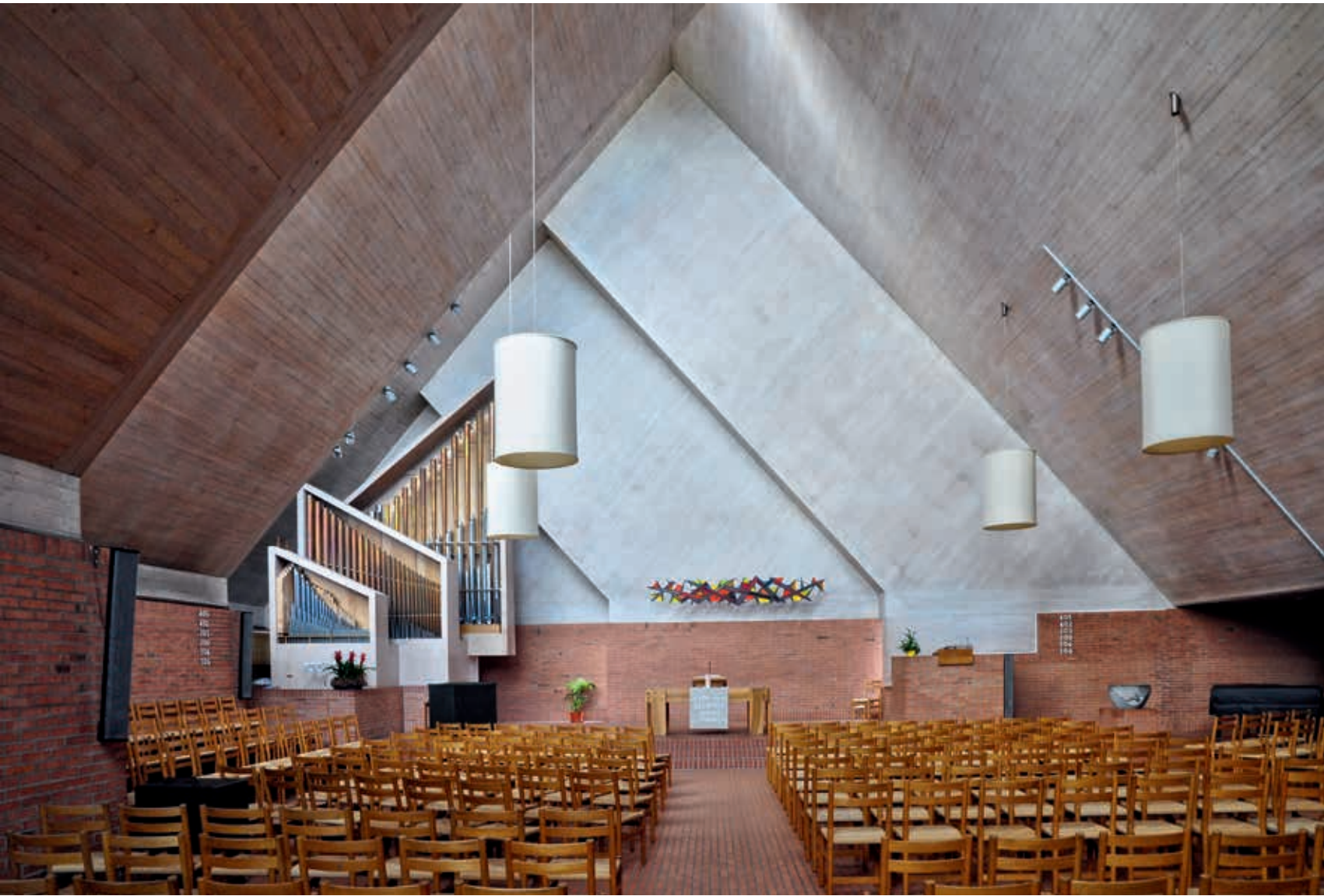
Innenraumgestaltung um 1960: Effretikon, reformierte Kirche, Ernst Gisel 1959–1961.