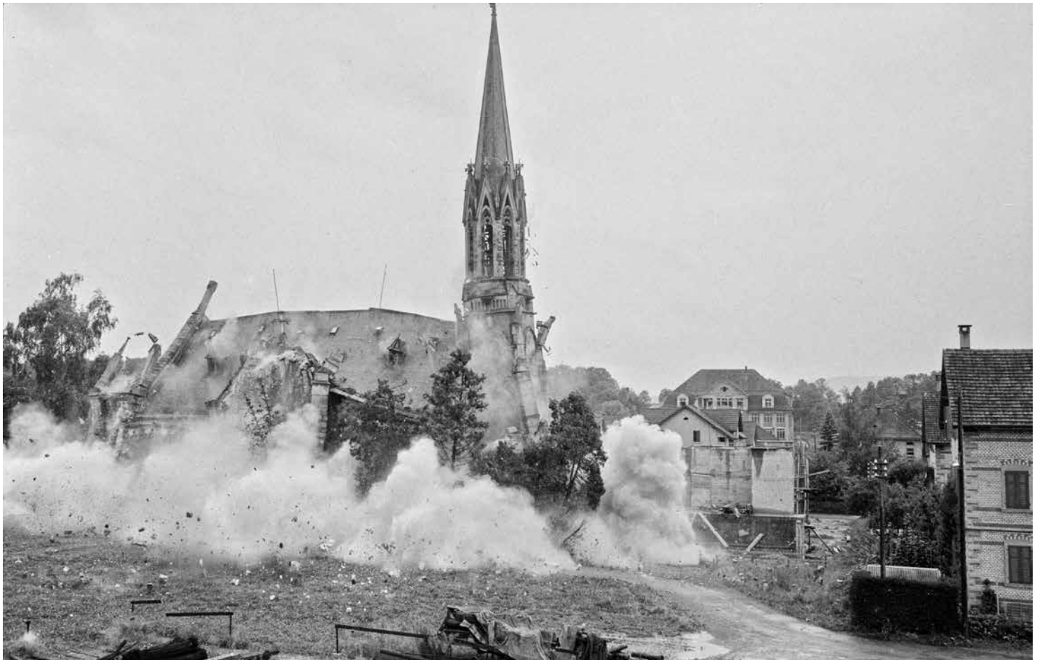
Sprengung der kath. Herz-Jesu-Kirche in Uster 1963 für den Neubau der St. Andreas-Kirche.

sondern künftig in der Stadt, aber auch auf dem Land ein Zentrum unter mehreren sein würden. Auch in der ersten Hälfte dieses Jahrzehnts sollte die Liturgie noch häufig als «Bauherrin» des Kirchenbaus bezeichnet werden, sie wurde aber zunehmend weiter definiert. 5 Denn nachdem das Zweite Vatikanische Konzil die aktive Teilnahme der Gemeinde zum bestimmenden Prinzip des Gottesdienstes gemacht hatte, sollte der Kirchenbau nun zum eigentlichen «Haus der Gemeinde» werden. Alle Lebensbereiche der Gemeinde sollten im Kirchenraum Platz finden können. Die Vorstellung, dass die (veränderte) Funktion den Bau definieren sollte, blieb also auch bei dieser Nuancierung des Kirchenbauauftrags erhalten. Der Kirchenbau war nun eine «Funktion» der Ekklesiologie. 6